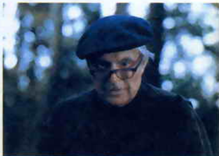
Кадры из фильма «Небеса обетованные».